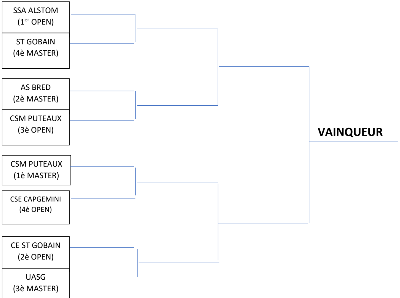
Tableau de poules :